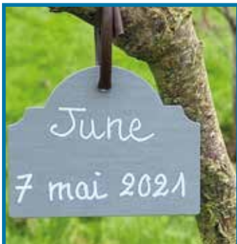
Chaque arbre est identifié par une petite étiquette

Des boissons chaudes et des gâteaux ont apporté leur note conviviale à cette activité.