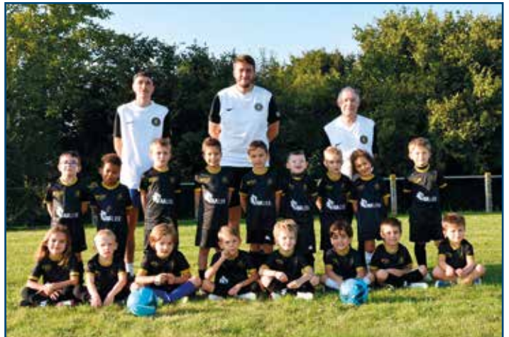
U6 - U7