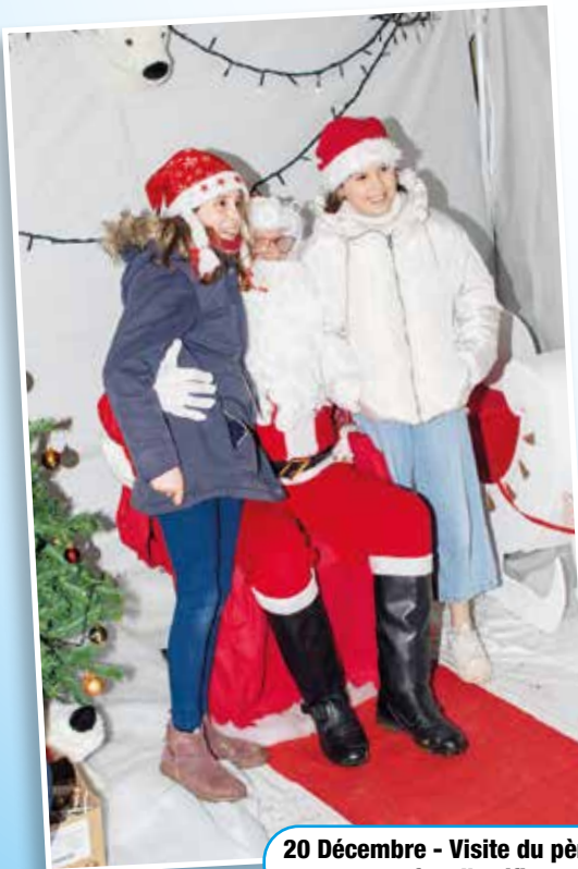
20 Décembre - Visite du père Noël et feu d'artifice