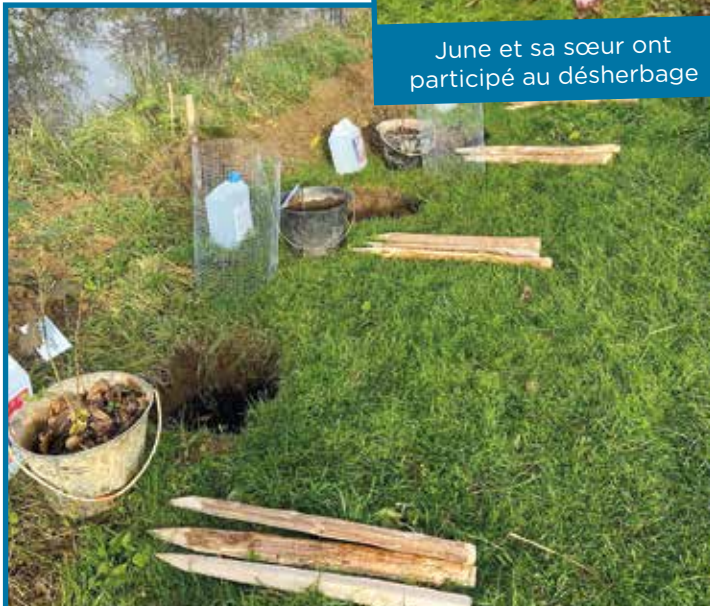
Tout est prêt pour la plantation