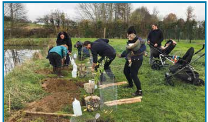
Au travail !