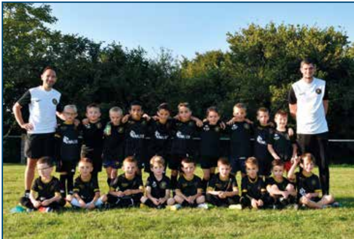
U8 - U9