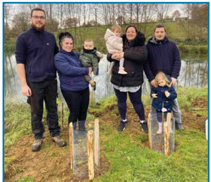
Deux familles ont participé : merci à eux !